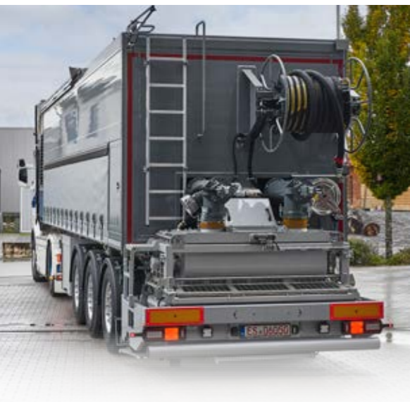
Auf engen und im Lichtraumprofil limitierte Baustellen ist der TransMix TML 3200 genau das Richtige.