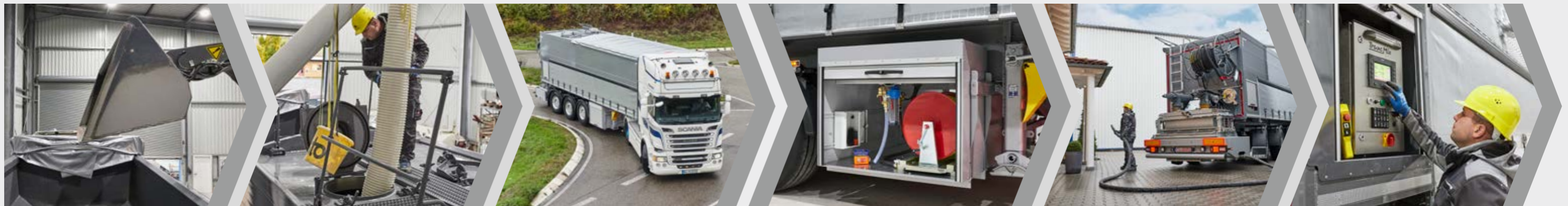
Laden des Zuschlags