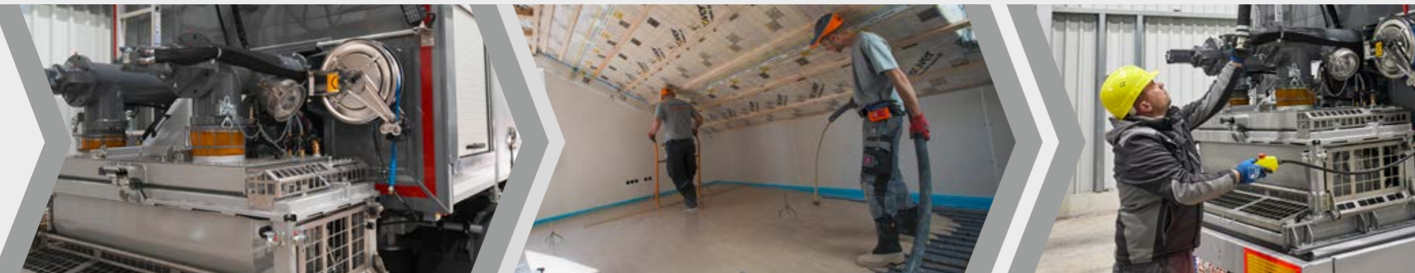
Vollautomatisches Mischen und Fördern