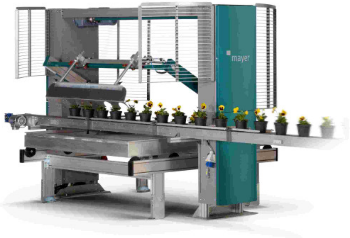
Absetzautomat TR 4103