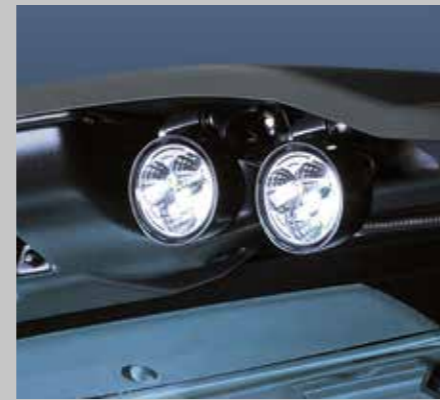
WARRIOR Dach LED (7250 TTV/9340 TTV) serienmäßig