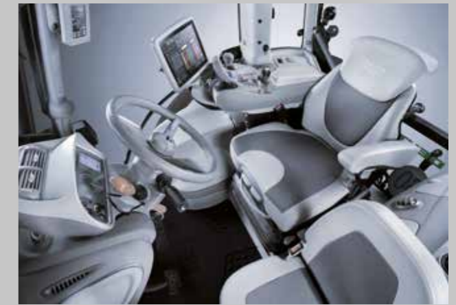
MaxiVision 2 Kabinenkomfort mit iMonitor 2.0, automatisierten Routinefunktionen und modernsten Precision Farming Systemen. Kein Job ist zu hart.

Der 9340 TTV WARRIOR ist das stärkste WARRIOR Sondermodell aller Zeiten. Es versetzt Lohnunternehmer und Landwirte in die Lage, auch die härtesten Jobs hocheffizient zu erledigen. Einen nach dem anderen. Überlegenheit in allen Situationen ist seine Mission. Auf dem Feld und auf der Strasse. Der 9340 TTV WARRIOR (336 PS / 247 kW) ist ein ultramoderner, hochintelligenter Großtraktor mit einzigartigem Bedienkomfort, automatisierten Routinefunktionen und den fortschrittlichsten Technologien. 47.000 Lumen Arbeitsbeleuchtung, MaxiVision 2 Kabinenkomfort, iMonitor 2.0, modernste Precision Farming Systeme, hocheffizienter Deutz-Motor mit modernster Abgastechnologie, stufenloses TTV-Getriebe für präzise Geschwindigkeiten von 0,2 bis 60 km/h bei reduzierter Motordrehzahl, neu entwickelte Achsfederung und trockene Scheibenbremsen, 12.000 kg Hubkraft, elektrisch öffnende Motorhaube, atemberaubendes Design – jede einzelne Komponente des 9340 TTV WARRIOR ist hochinnovativ und gehört zum Besten, was es auf dem Markt gibt. Damit machen Sie Ihren Job fertig, bevor er Sie fertigmacht.