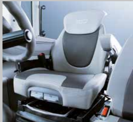
WARRIOR Komfortsitz (7250 TTV/9340 TTV)