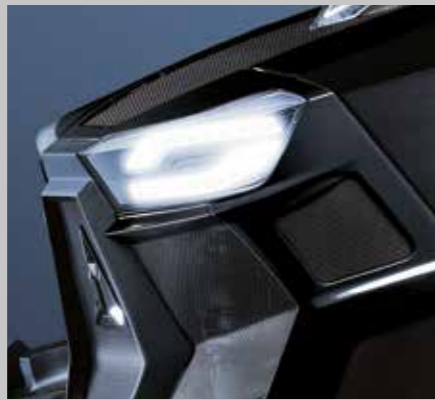
WARRIOR Front LED / brillantschwarze Lackierung (7250 TTV/9340 TTV)