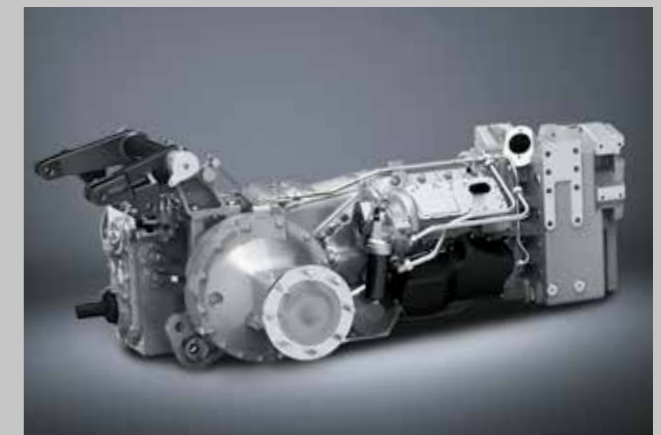
Spitzeneffizienz. Stufenloses TTV Getriebe für bis zu 60 km/h Höchstgeschwindigkeit bei reduzierter Motordrehzahl.