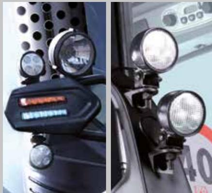
WARRIOR Kabinen LED vorne/hinten (7250 TTV/9340 TTV) optional