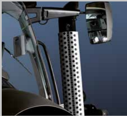
Auspuff mit Edelstahlblende (7250 TTV/9340 TTV)