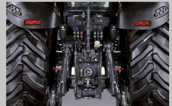
12.000 kg Hubkraft, 210 l/min Pumpenleistung, drei Zapfwellengeschwindigkeiten. Ausgelegt um jedes Anbaugerät zu meistern.