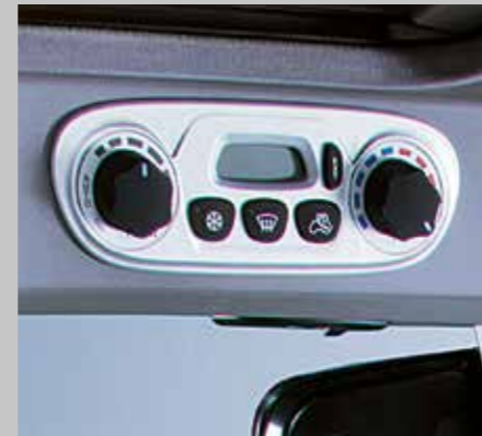
Klimautomatik (7250 TTV/9340 TTV)