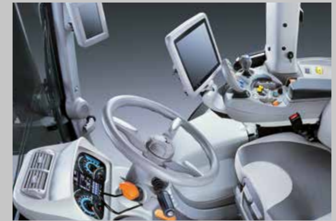
MaxiVision 2 Kabine mit neu designter Armlehne und 8" oder 12" iMonitor. Maximaler Komfort für maximale Kampfkraft.

Der neue 7250 TTV WARRIOR ist das stückzahllimitierte Sondermodell für die härtesten Einsätze auf dem Feld und auf der Strasse. Maximale Produktivität ist seine Mission – brillantschwarz lackiert um brillante, schwarze Zahlen zu schreiben. Ein hochattraktiver 246 PS (181 kW) Traktor, der sich durch die typischen deutschen Eigenschaften wie Qualität, Präzision und Zuverlässigkeit auszeichnet und sowohl ökonomisch als auch ökologisch auf dem allerneuesten Stand der Technik ist. Der vorbildliche Kabinenkomfort der MaxiVision 2 Kabine, die intuitive Bedienung, modernste Precision Farming Systeme, innovative Achs- und Bremskonzepte und Anbauräume für die schwersten Gerätekombinationen – die hochinnovative und hochintelligente Traktorentechnologie macht den 7250 TTV WARRIOR zum idealen Arbeitsgerät für Lohnunternehmer und Landwirte, die ihre Professionalität nach außen sichtbar machen wollen. Die Saison wird hart. Mit dem 7250 TTV WARRIOR sind Sie härter.