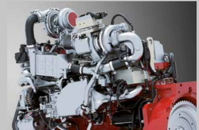
246 PS/181 kW Deutz-Motor. Reagiert sofort mit hohem Anfahrtdrehmoment und großen Drehmomentreserven bei bis zu 5% weniger Kraftstoff- und AdBlueverbrauch.