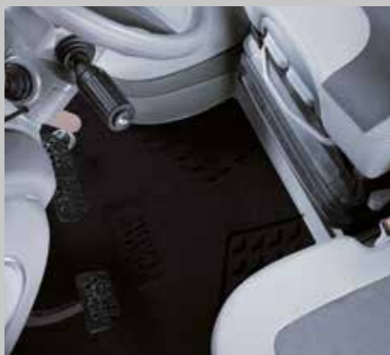
WARRIOR Fußmatte schwarz (7250 TTV/9340 TTV)