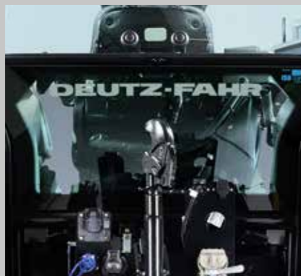
Doppelverglasung hinten (7250 TTV)