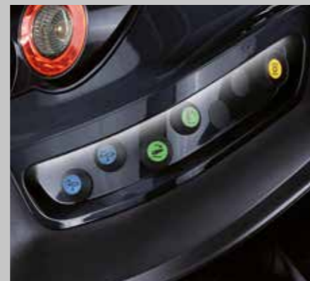
LED Beleuchtung für externes Bedienfeld (7250 TTV)