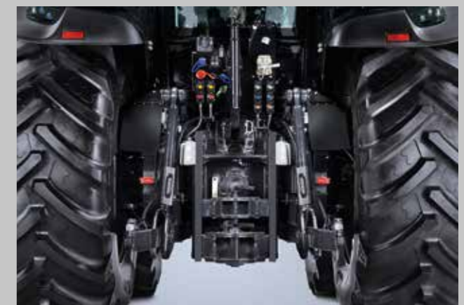
Bis 160 l/min Hydraulikpumpenleistung, 10.000 kg Hubkraft und vier Zapfwelengeschwindigkeiten. Damit geht alles.